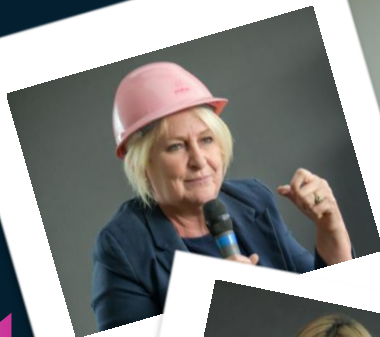
1k Youtube Piccadilly